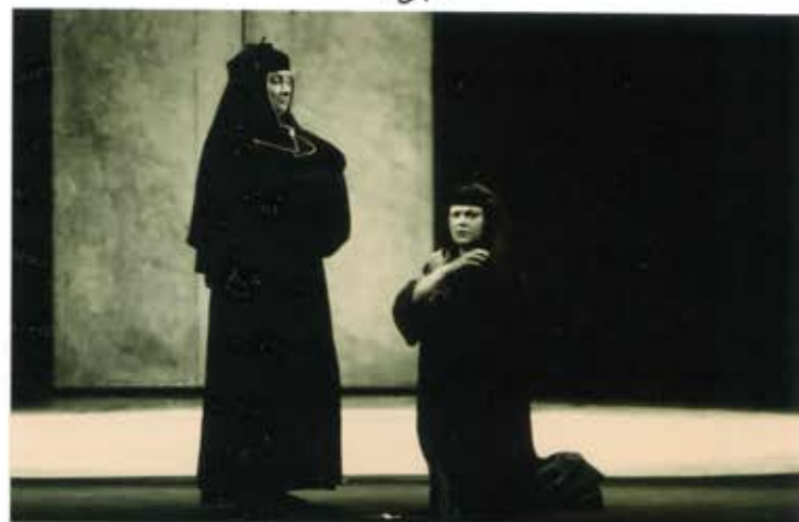
13 2 /N