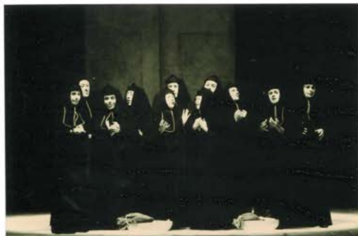
7 2 /N