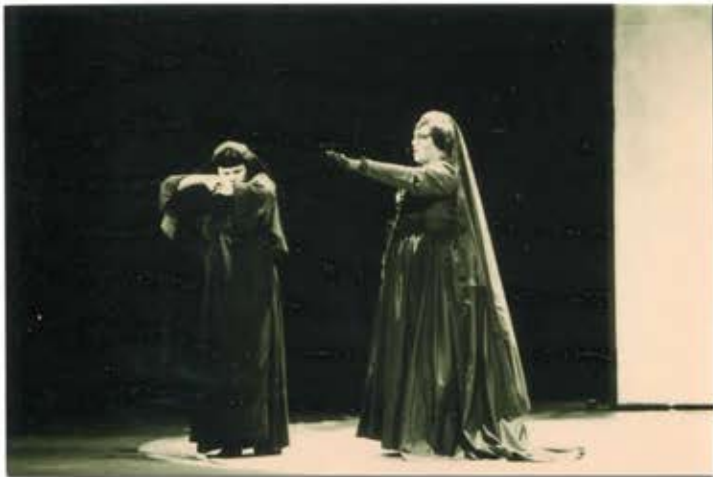
26 2 /N