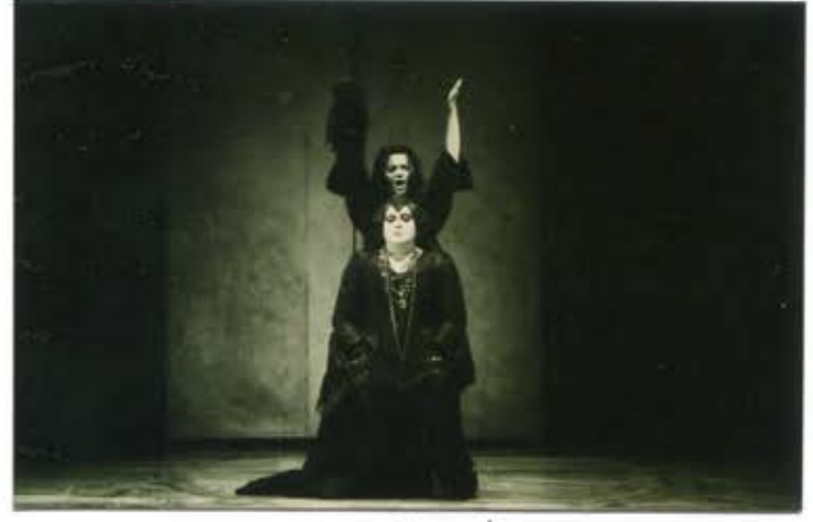
29 2 /N