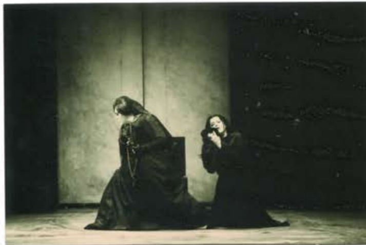
28 2 /N