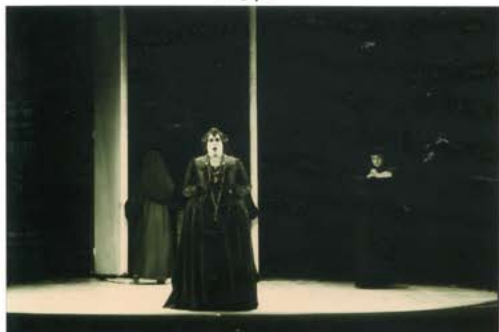
16 2 /N