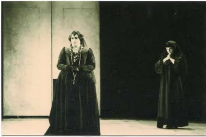
18 2 /N