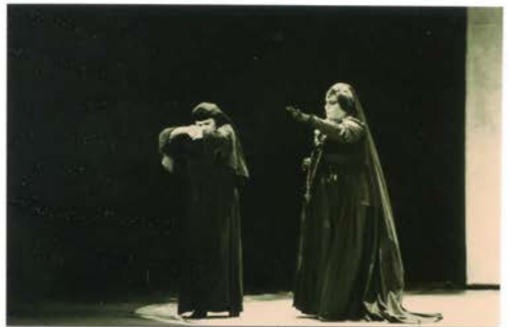
27 2 /N