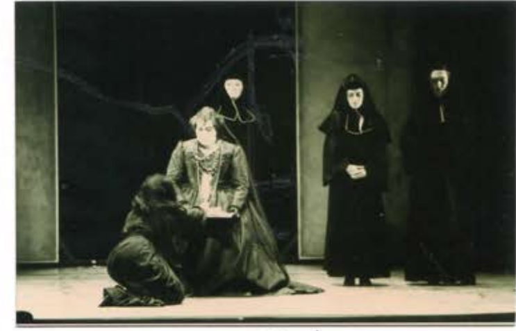
31 2 /N