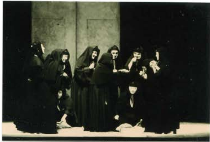
6 2 /N