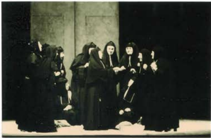
5 2 /N