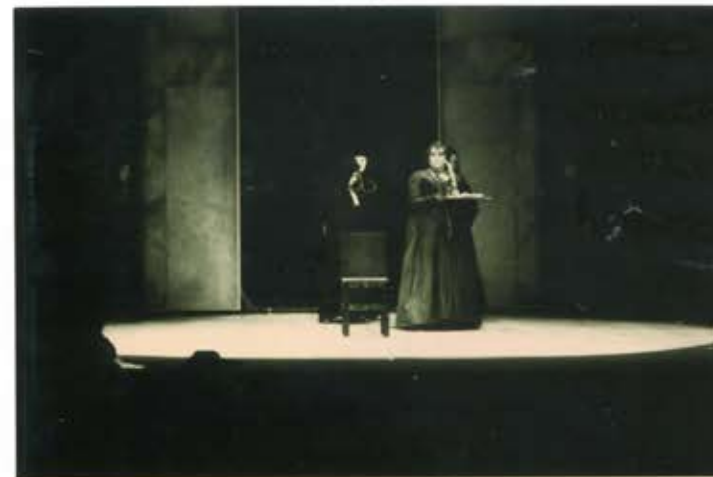
30 2 /N