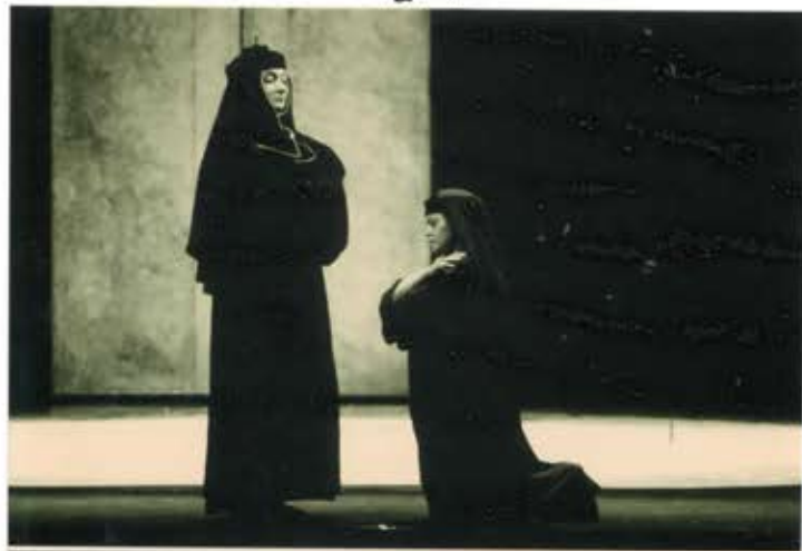
12 2 /N