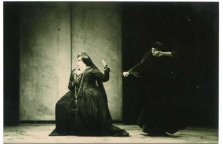
19 2 /N