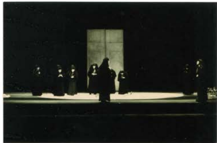
8 2 /N