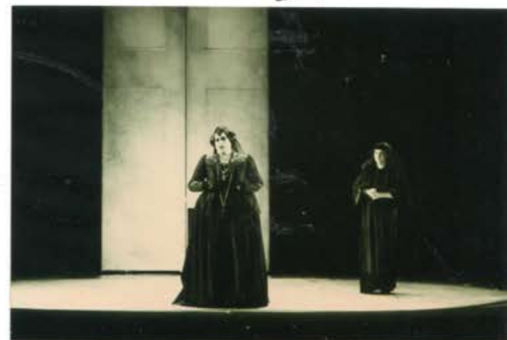
17 2 /N